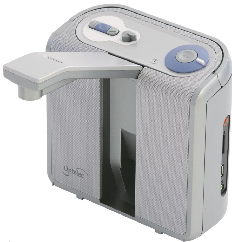
CLEARREADER+ generation 2 20170425