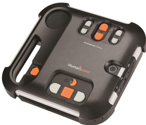
Victor Stratus 4 med överlägg monterat

Vid leverans följer, förutom själva spelaren, tangentbordsöverlägget och denna instruktion, följande med: