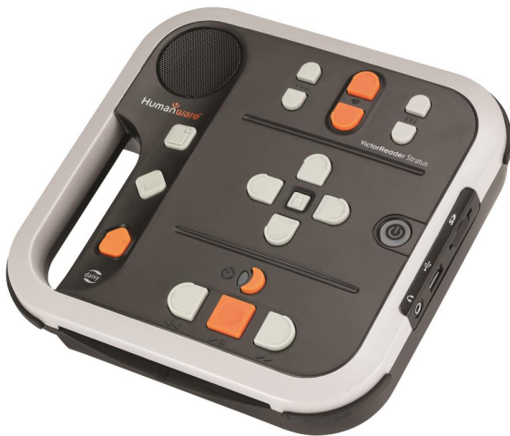
Victor Stratus 4 utan överlägg

Vid leverans sitter ett överlägg av plast på spelaren. Det täcker en del tangenter. Spelaren kan användas med överlägget på men får då lite begränsade funktioner.